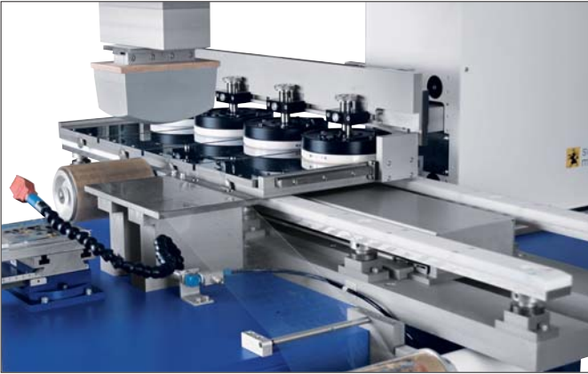
TPX 550 – 6-Farbendruck – mit Transfert Carré und Tamponreinigung TPX 550 – 6 colour print – with Transfert Carre and pad cleaning device