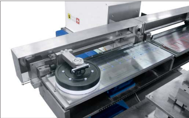
TPX 550 mit Verschiebetisch und Sicherheitsverschalung mit Lichtschranke TPX 550 with shuttle table and safety guarding with light curtain